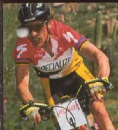
NED OVEREND, EINE LEGENDE DES MOUNTAIN-BIKING, GEWANN 1991 DIE WELTMEISTERSCHAFT UND FÜHRTE NATIONALE NORBA-MEISTERSCHAFTEN.